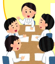
勤務医部会員 企画

(例) 勤務医部会員（個人含む）が主催する「勤務医や研修医による勉強会」等のイベント