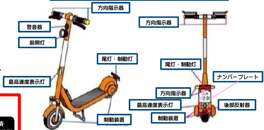
特定小型原動機付自転車に必要な主な保安部品

A 右図のような部品を備えている必要があります。 下の性能等確認済シール等の付けられているものは、基準を満たしています。