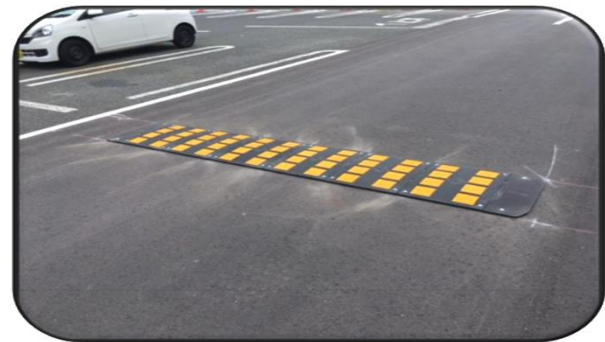
○ハンプ(凸部)の設置