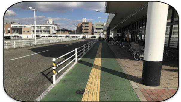
○歩車分離された通路